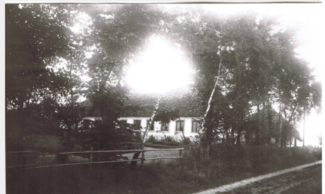
Højlundgaard set fra syd omkring 1930.