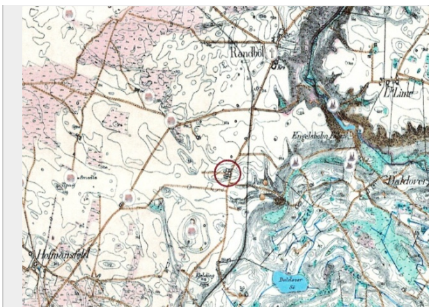
Højlundgaards beliggenhed på kortet fra omkring år 1900.