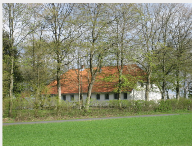
Højlundgaard set fra sydøst ved løvspringstide år 2010.

Huset skulle i følge kilderne være fra 1871. (Se under Nis Hansen).