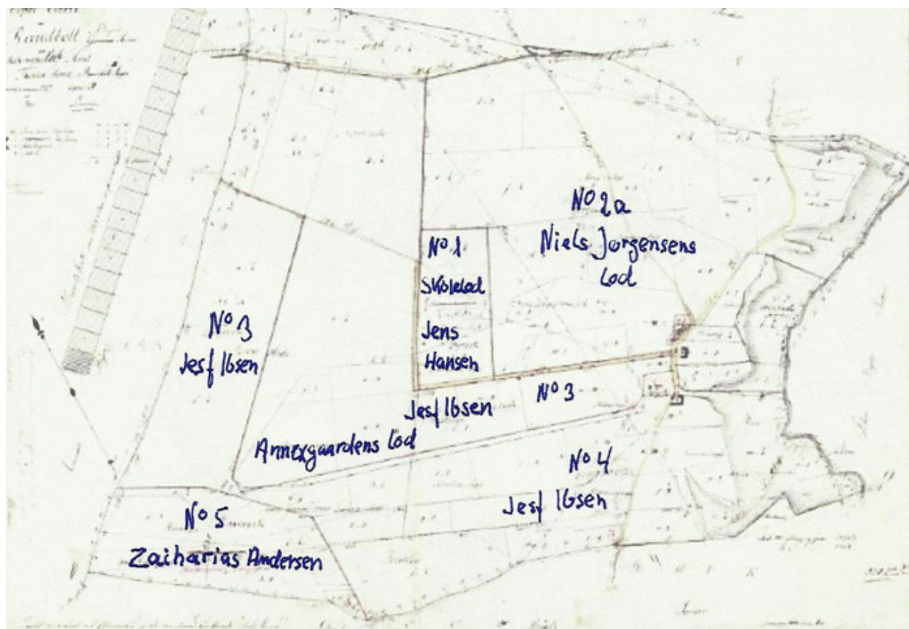
Matrikelkort fra 1820 over Randbøl ejerlaug. Kortet er påført navne på parcellernes ejere. Kort- og Matrikelstyrelsen.