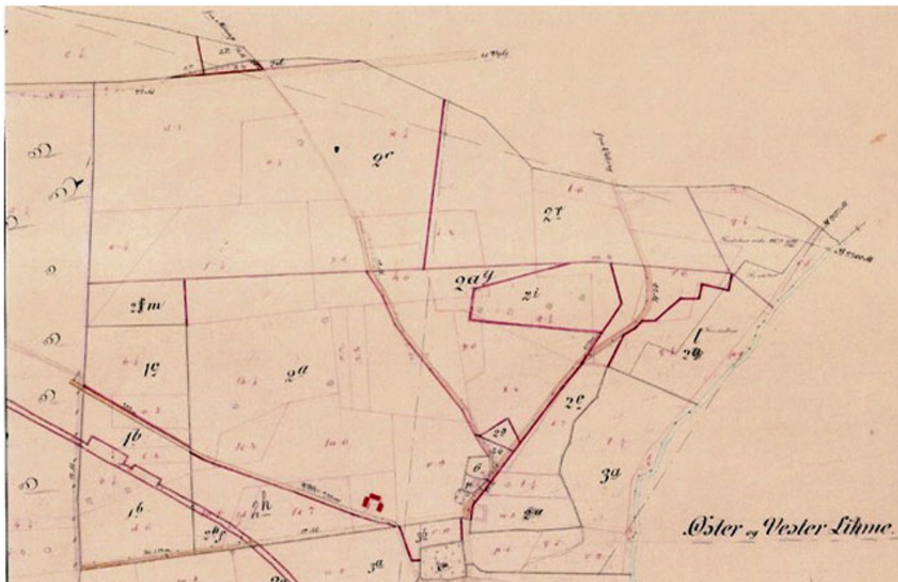
Matrikelkort over parcellerne omkring Randbøl Vestergaard matr. nr. 2a, som er angivet med rødt, men på det forkerte sted. Lynghøjgaards jord ses øverst med matr. nr. 2c og 2r. Kort og Matrikelstyrelsen.