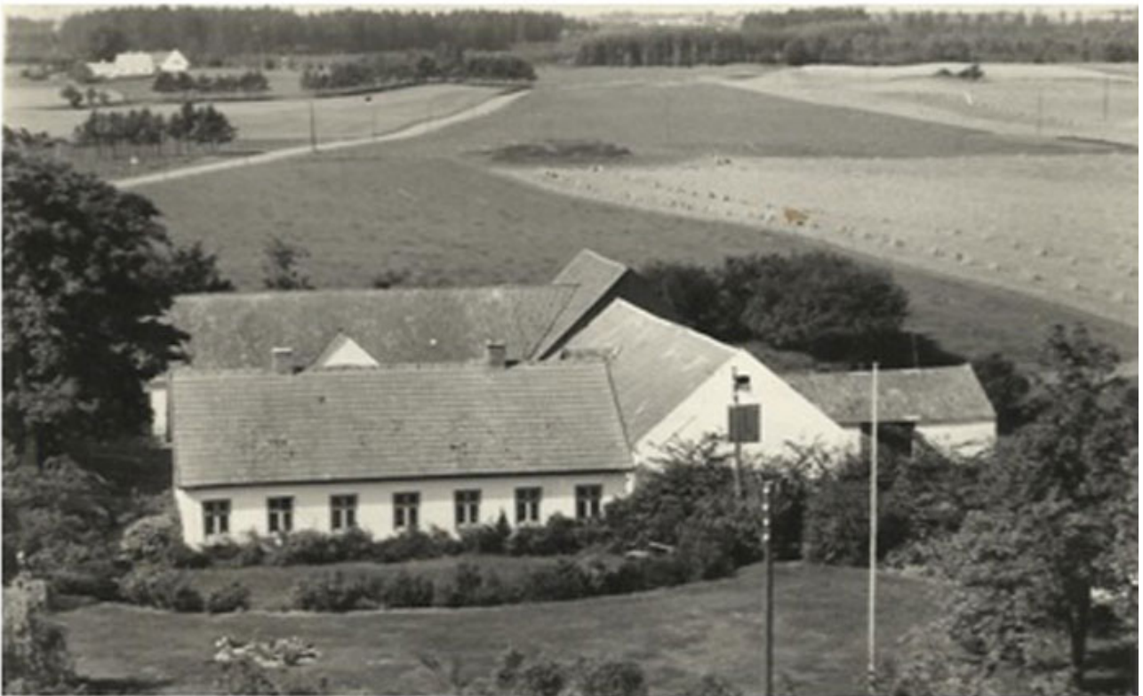
Randbøl Vestergaard 1962 set fra øst. Vandel by anes midt i billedet bag Randbøl skov.