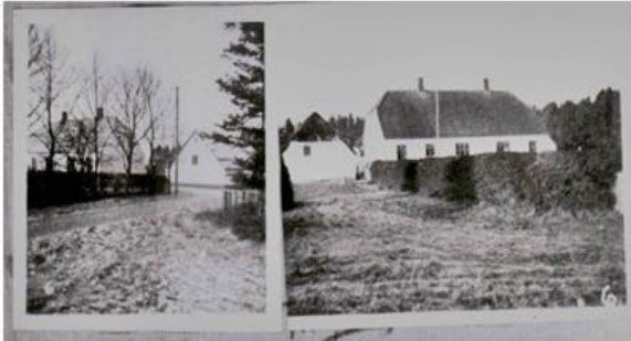
Bremersminde anno 1943 set fra henholdsvis nordøst og øst.