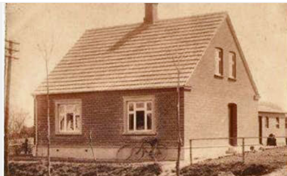
Huset Gl. Stationsvej 3 i Vandel.