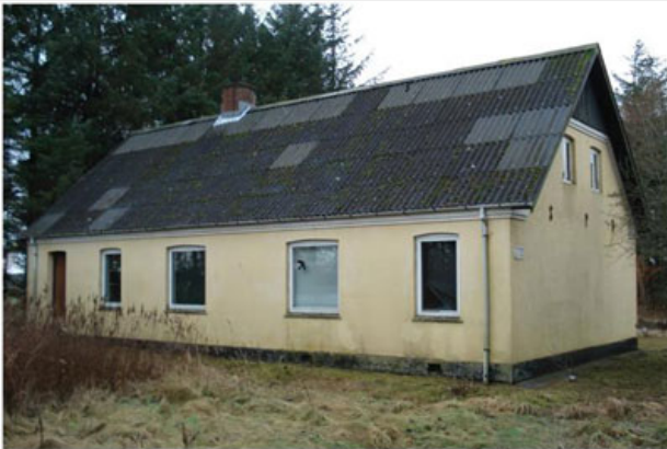
Bygning 270 anno 2011. Bemærk Søren Pedersen Bremers initialer på gavlen.