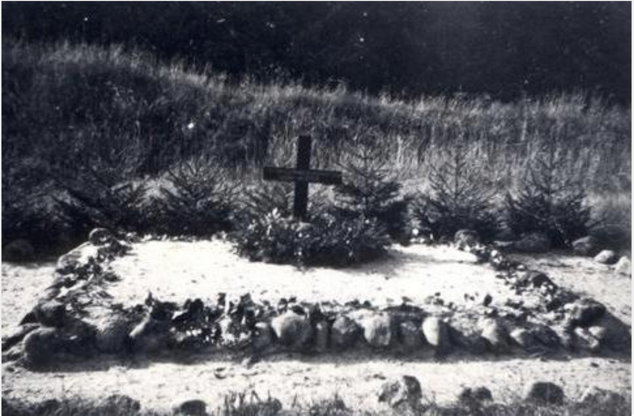
Billedet af graven ved Flyverskjulet, som Vagn Rasmussen tog inden han forlod Vandel i oktober 1945

Som en efterskrift er anbragt ovenstående foto af engelsk flyvergrav i Vandel, som jeg fotograferede mit under soldaterophold i 1945. Modsætningen til vort slappe soldaterliv i Vandel, er deres militære aktivitet med livet som indsats i en kamp for deres land og for vort lands frihed.