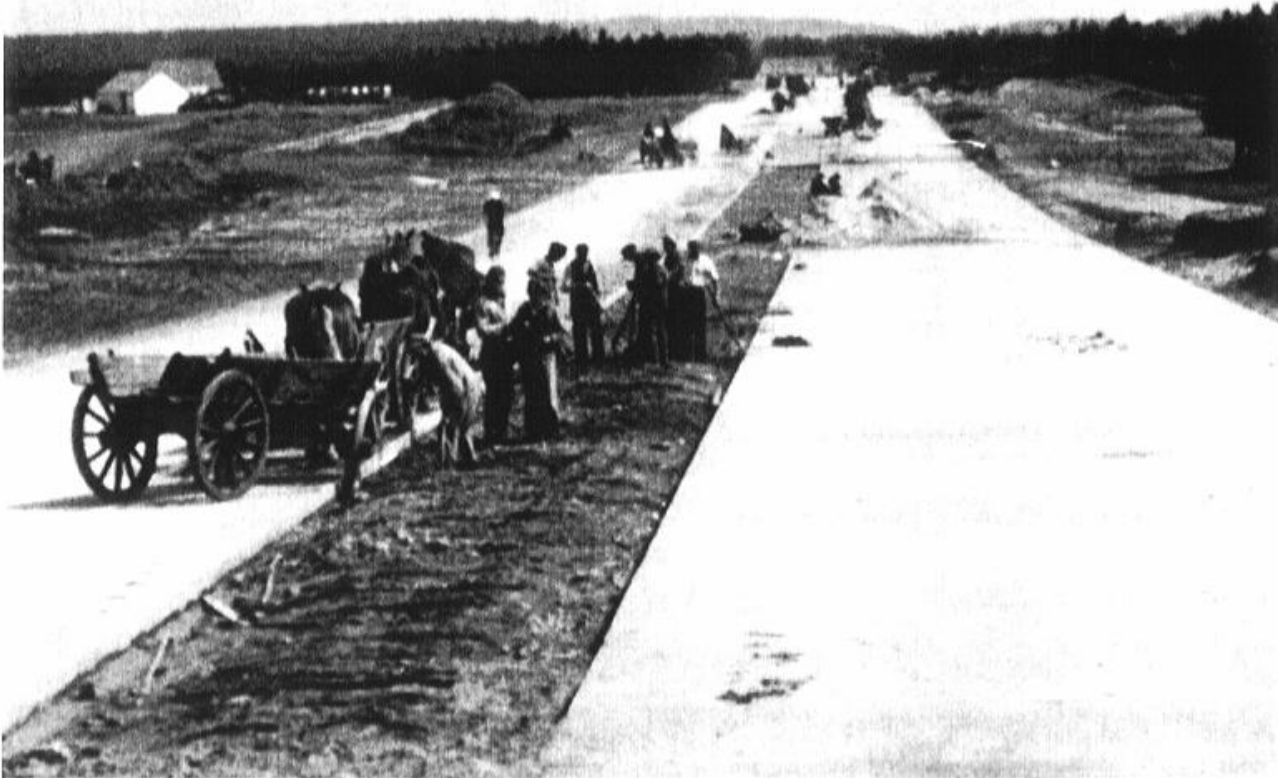
Støbning af rullebanen på Fliegerhorst Vandel. Rullebanen fra starten af 18 meter bred og 30 kilometer lang.

børn, og der faldt af og til et bolsje af til os. Selvfølgelig tænkte de hele tiden på deres familie i Tyskland.