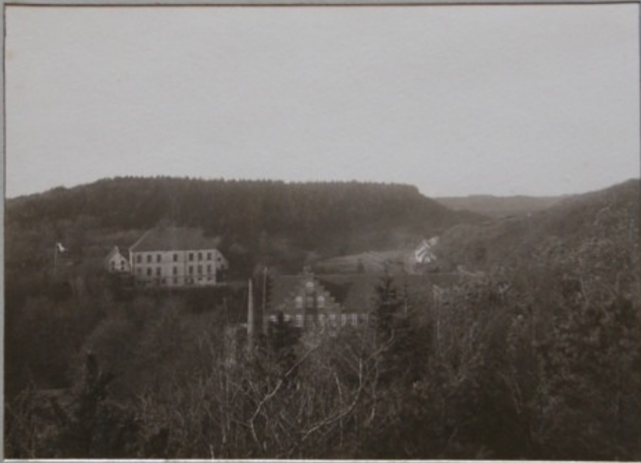
FRA FRUENS BÆNK