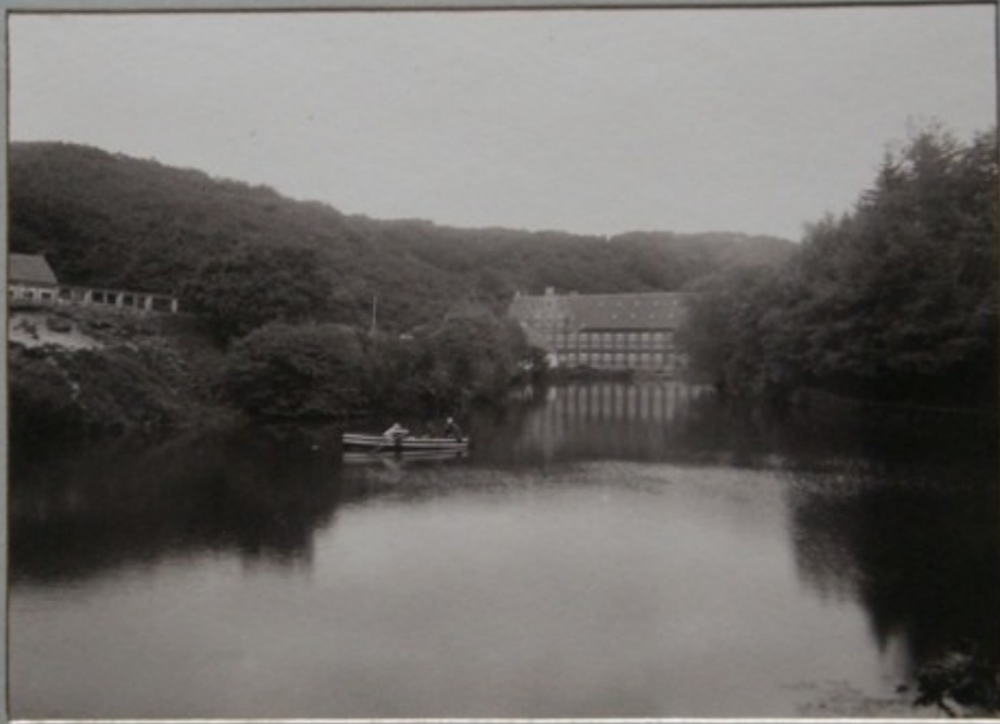
FRA ADAS BÆNK