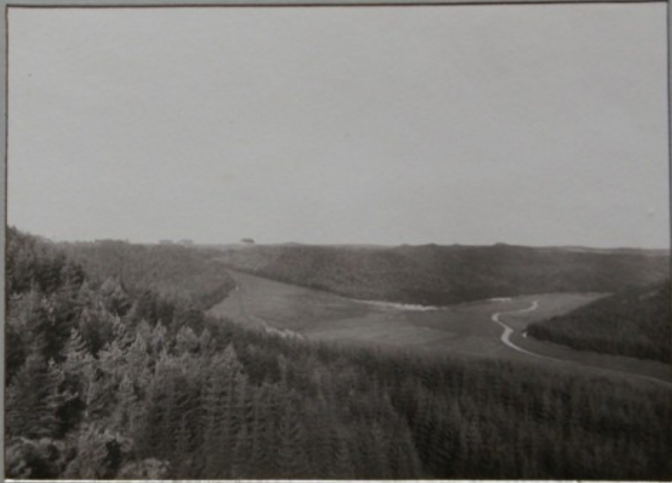
VED FREDENS BÆNK