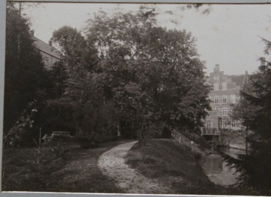
FRA ANLÆGET VED KILDEN