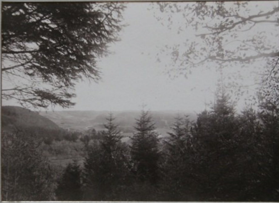
FRA CONSTANCE HILL