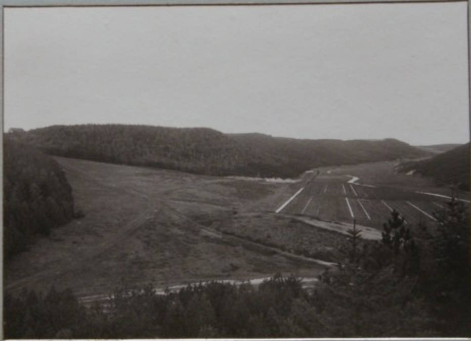
VED STUDENTERNES BÆNK